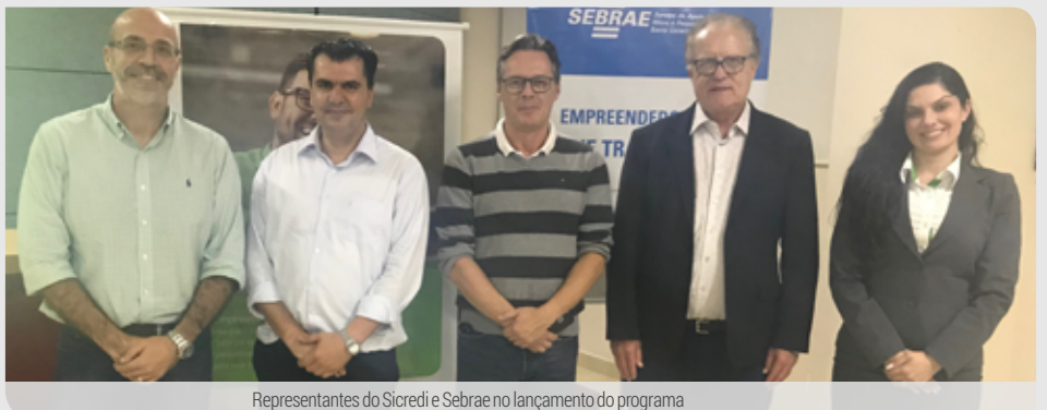
Representantes do Sicredi e Sebrae no lançamento do programa