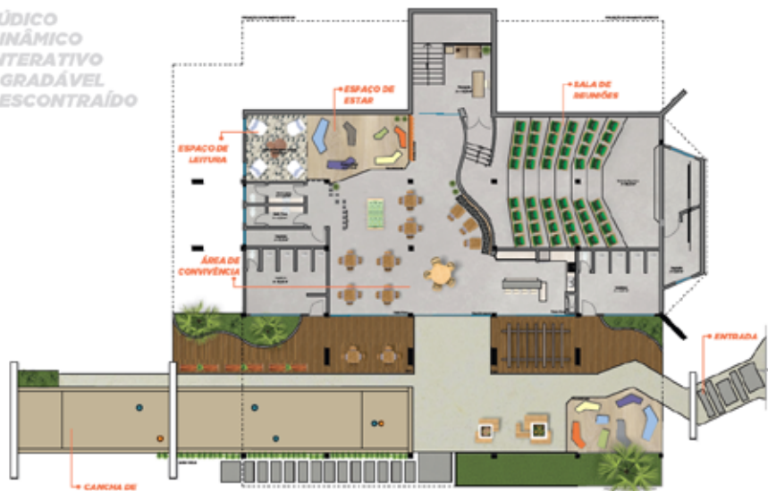
Planta Humanizada - Clube Próspera

LÚDICO DINÂMICO INTERATIVO AGRADÁVEL DESCONTRAÍDO